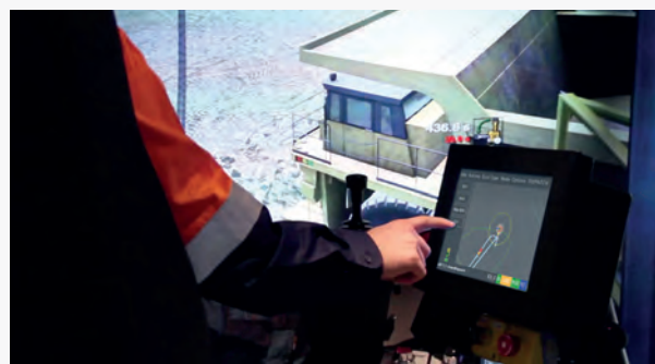
Solusi Pelatihan untuk Sistem Cat® Command for Hauling, Solusi Pelatihan untuk Komatsu FrontRunner® Autonomous Haulage (AHS).

Dengan solusi pelatihan berbasis simulasi yang diterapkan di 32 lokasi pengangkutan otonom di seluruh dunia, Immersive Technologies memiliki keahlian untuk memenuhi kebutuhan utama pelatihan. Immersive Technologies akan mendukung tambang di setiap tahap implementasi, menggunakan sistem pembelajaran terintegrasi, simulasi, dan analitik kinerja manusia untuk mengurangi risiko implementasi.